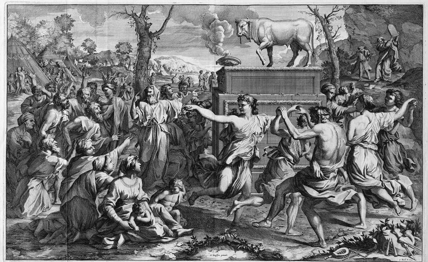
Boekillustratoren Jan en Casper Luyken, Amsterdam Museum